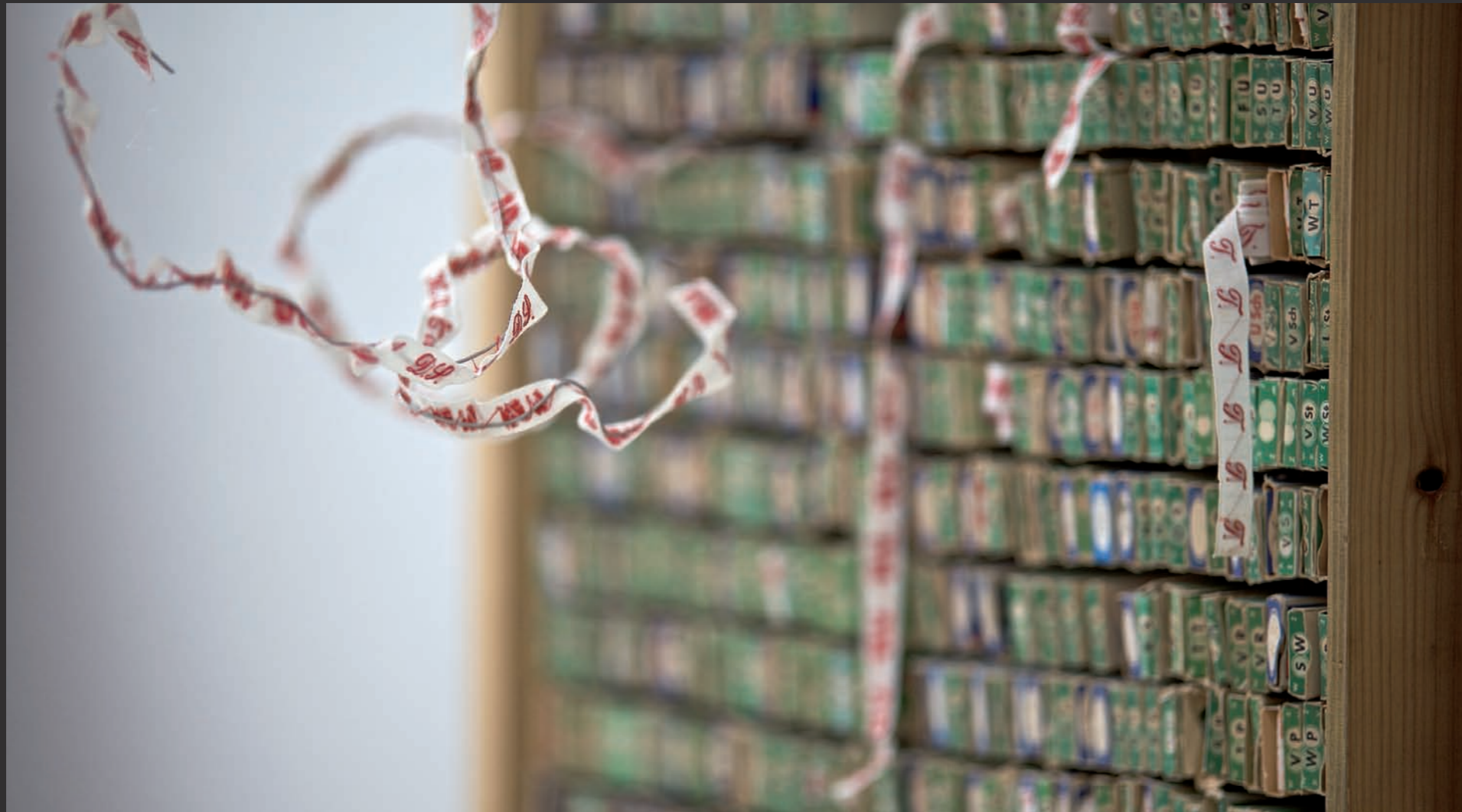
Katja van Dyck-Taras Objekte